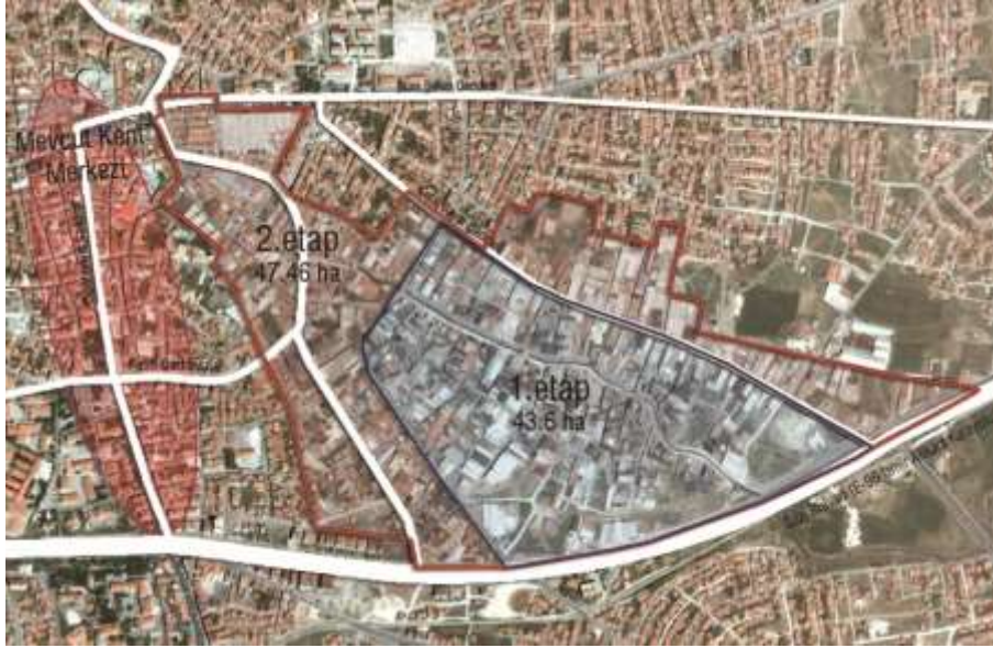
Şekil 3.1: Proje alanının kent içindeki konumu [1]

Uşak Eski Tabakhane Bölgesi, Sarayaltı ve Durak Mahalleleri sınırları içinde yer almakta ve söz konusu alanın, kentin ana ulaşım omurgası olan Ankara-İzmir yoluna cephesi bulunmaktadır. Kent merkezine yakın bir konumda olan alan, zamanla kent içinde kalmış, süreç içinde de kent merkeziyle bütünleşmiştir ve bu nedenle kentsel yeni alanlar planlanması için önem teşkil etmektedir (Şekil 3.1).