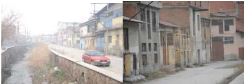
Şekil 3.2: Dönüşüm uygulaması öncesi fabrikaların fiziki yapısı [1]

Kentin gelişimi ile birlikte tabakhane bölgesinin kent merkezi ile mekansal açıdan neredeyse birleşmiş durumda olmasına rağmen işlevsel açıdan bütünlük arz etmeyen bir durum sergilemesi, bunun yanı sıra estetik olmayan görünümü ve çevre kalitesinde yaşanan olumsuz değişimler gibi nedenlerle kentsel dönüşüm uygulamasını gündeme getirmiştir.