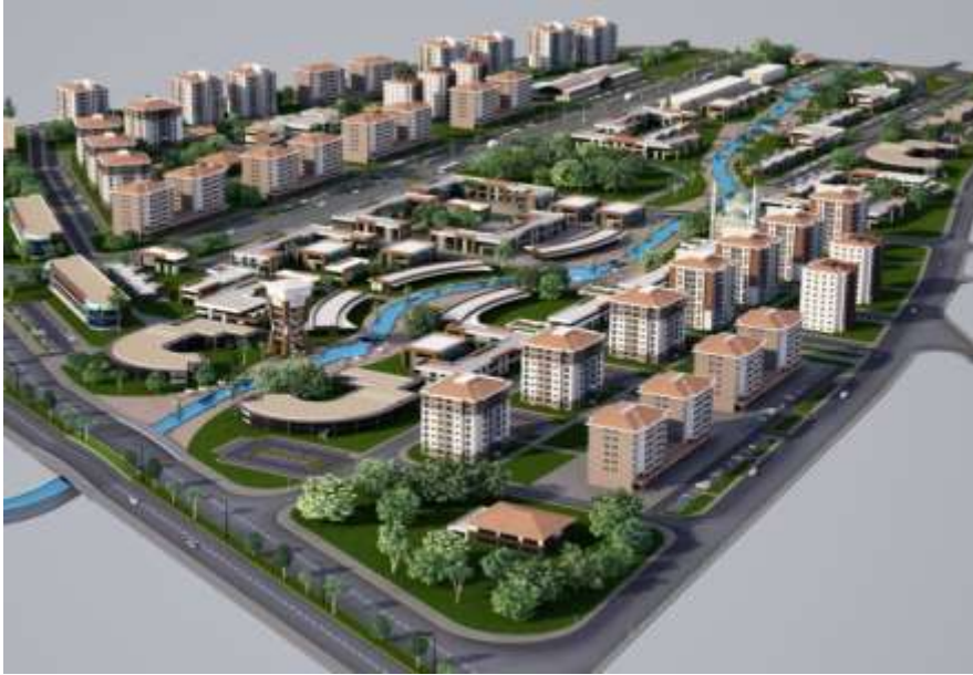
Şekil 3.4: Kentsel Dönüşüm Uygulaması [1]

Uşak eski tabakhane bölgesinde kentsel dönüşüm uygulaması ile küçük sanayi alanında işlev değişikliği yapılarak kent ölçeğinde hizmet verecek ticari alanlar, konut alanları, diğer donatılar ve rekreatif kullanım amaçlı kamusal alan tasarımları gerçekleştirilmiştir. Bu tür kullanımlar, alanın canlılığını koruyarak günün farklı saat dilimlerinde çeşitli kullanıcıya hitap etmeyi öngörmektedir (Şekil 3.4).