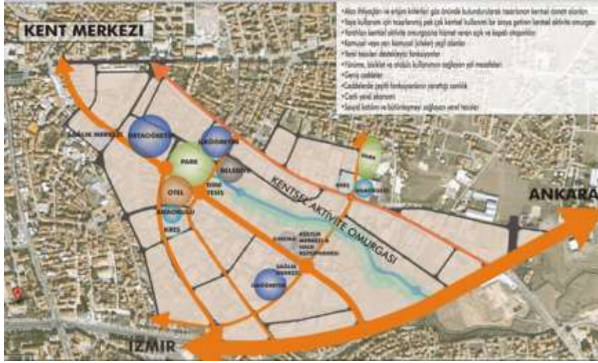
Şekil 3.3: Kentsel Tasarım Planı [1]

planında, alanın fiziki yapısının iyileştirilmesi için eski yapı dokusu temizleme işlemi ile tamamen ortadan kaldırılmış ve işlev değişiklikleri yapılarak dönüşüm alanının kent merkeziyle entegrasyonunun sağlanması amaçlanmıştır.