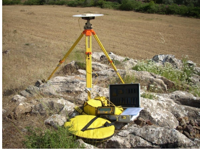
Şekil 1: PTKV noktasından bir görüntü

Jeodezik veri, 2009 ve 2010 yıllarında gerçekleştirilen GPS kampanyalarından elde edilmiştir ve GAMIT (King and Bock, 2004) / GLOBK (Herring, 2004) bilimsel yazılımı kullanılarak 15 adet istasyona ait hızlar elde edilmiştir (Şekil 2).